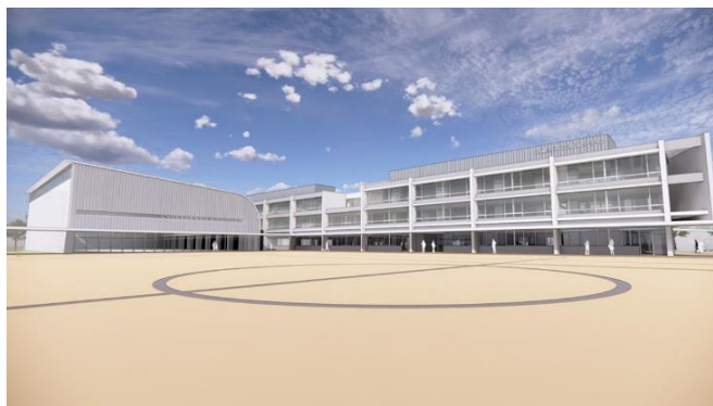
校庭からのイメージ