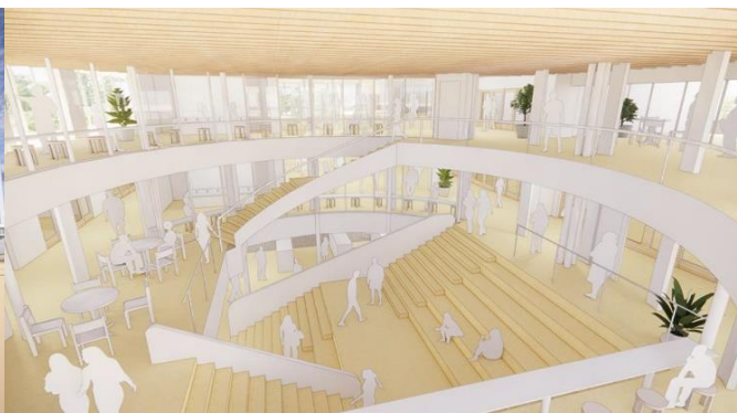
3階から2階の図書館を見たイメージ