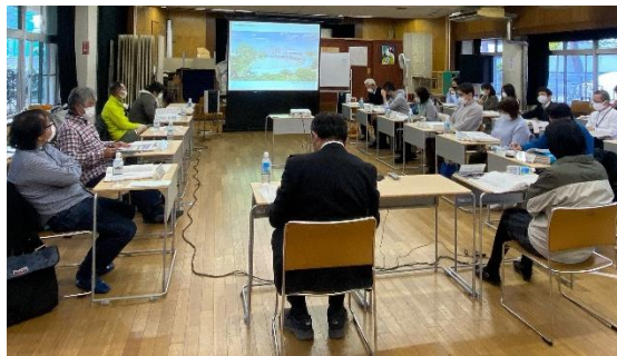
第9回五中改築懇談会の様子

また、新校舎の概略平面図案、現時点でのイメージパースをお示しし、今後の改築事業のイメージを共有しました。さらに、第五中学校の工事ステップと、次に改築を予定している第五小学校への影響について改めて委員の皆様にご説明し、意見交換を行いました。