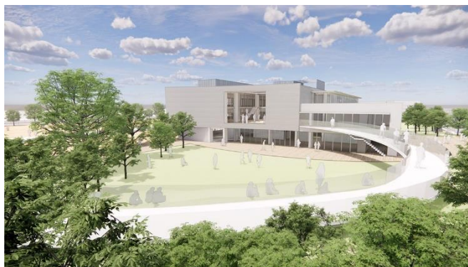
Mori コモンズからのイメージ